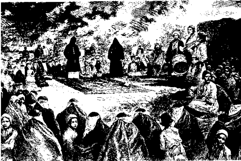
یکی از مراسم تعزیه‌خوانی در زمان فاجعه در شهر قزوین ظاهر این آئین عزاداری برای قتل یک نازی، ولی باطن آن سوگواری برای ترور هوش و خرد انسانها بوسیله واعظان و دکانداران مذهبی است.