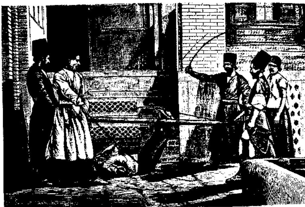
مراسم اجرای حکم دادگاه شرع نشانه‌ای از فساد اندیشه‌گری و ستمدینی در دوره پادشاهان قاجار