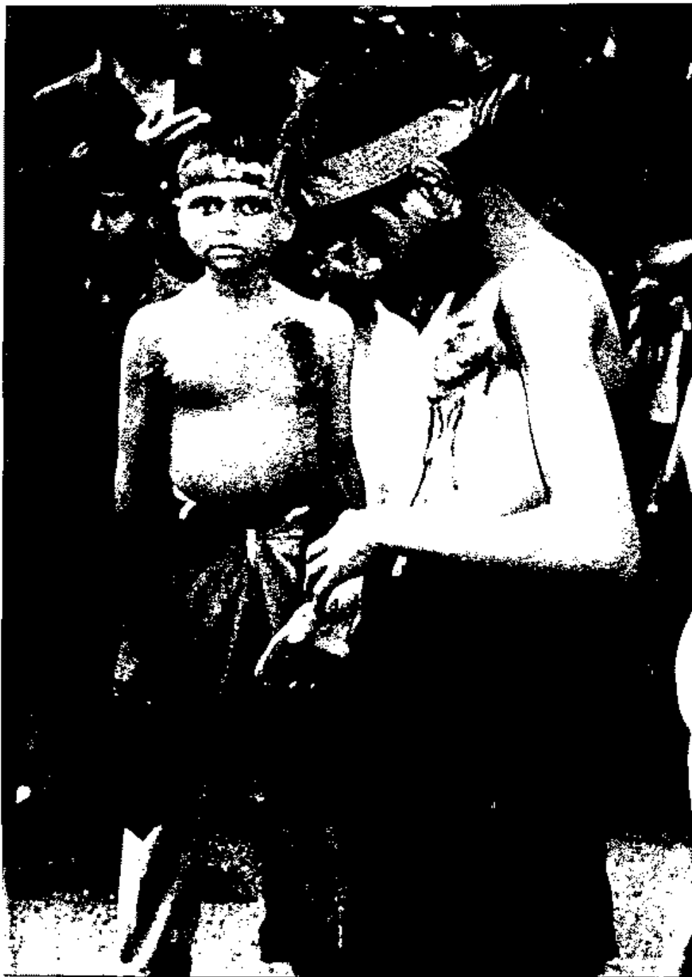
افراد ملتشی که خرد خود را قربانی خرافات برمنش میکنند، این مصیبت‌ها را به سر خود می‌آورند.