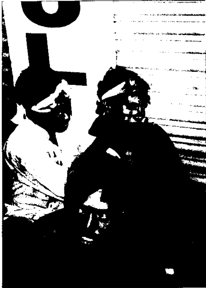
نشانه‌هایی از خردباختگی‌های پیروان شیعه‌گری انسانهای زنده و با فرهنگ، ولی خردگم‌کرده‌ای که در عزای انسانهای مرده و بدون فرهنگ زیر تأثیر افسونهای مذهبی، بدن چاک کرده‌اند.